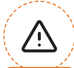
데이터 이상 감지